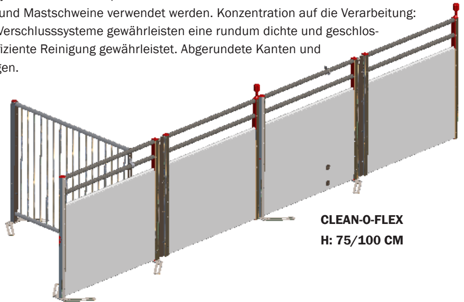
CLEAN-O-FLEX H: 75/100 CM