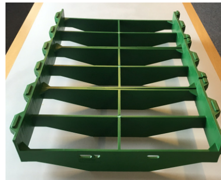
560300 Einlegeboden 20x40 cm für Polymerplatte, grün (3 Stück je Polymerplatte)