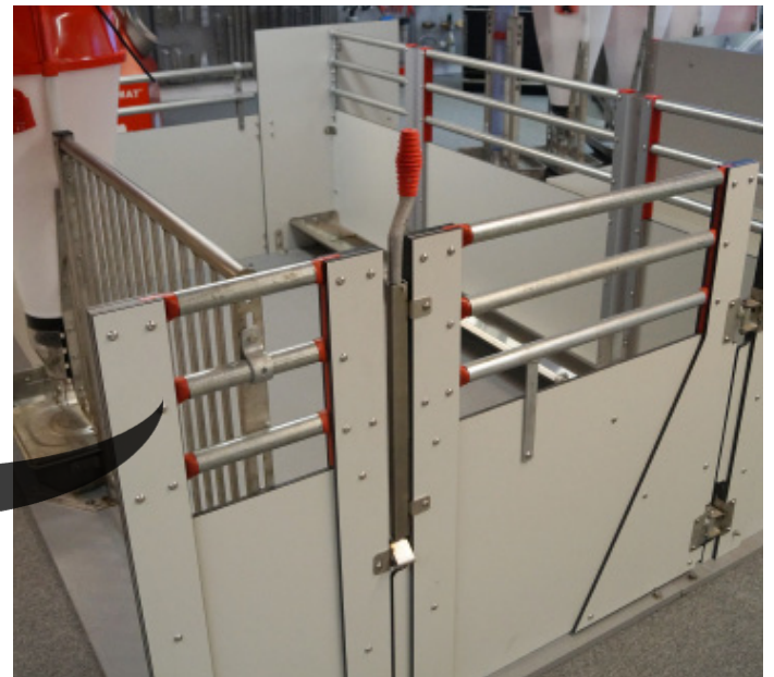
FUNKI FIBER mit Schwenktor und Stabverriegelung

Änderungen im Material und Design vorbehalten.